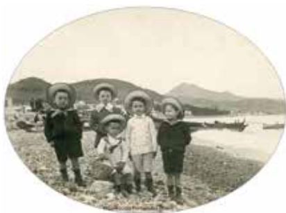
Niños posando en la playa de la Malagueta, positivo en gelatina de plata, hacia 1910