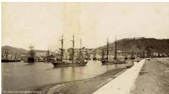
Veleros en el muelle viejo de Málaga, autor desconocido, albúmina, hacia 1870

Además de estas actividades, Juan Antonio, funda en 1994, junto a otros socios la Editorial Miramar SL. En 1997, igualmente con otros socios, la empresa Zoconet SL, propietaria del sitio web Todocolección, que con sus más de 40 empleados y cerca de 40 millones de objetos en venta, es hoy el referente en España del mercado del coleccionismo. En 2008, funda junto a su esposa, Claroscuro Ediciones SL.